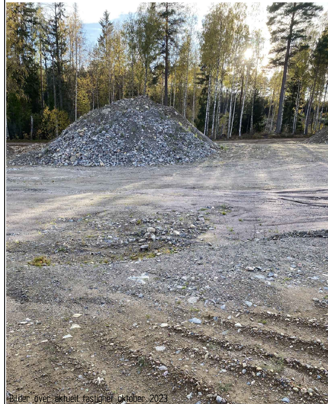
Bilder över aktuellt fastighet oktober 2023