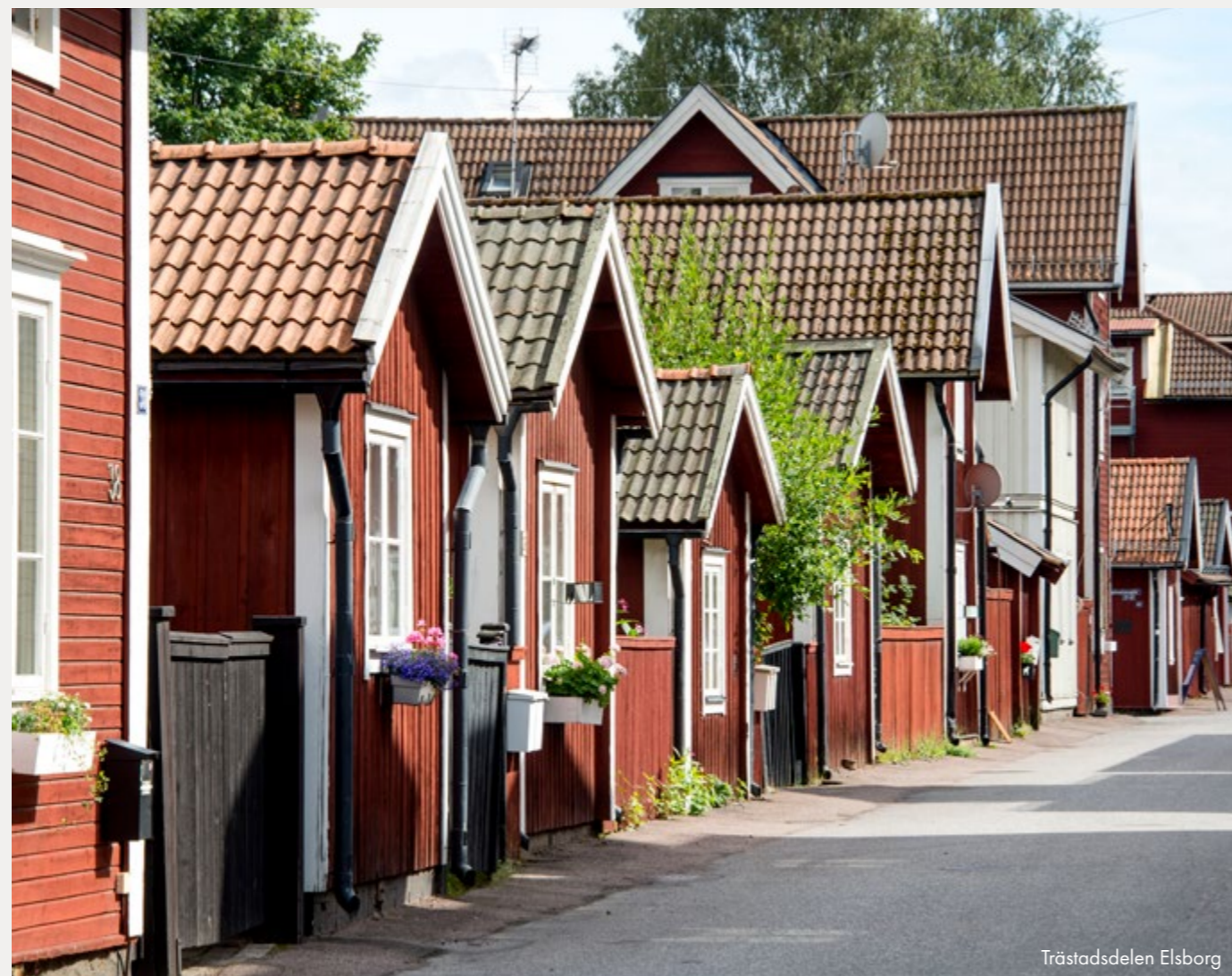
Trästadens delens Elsborg