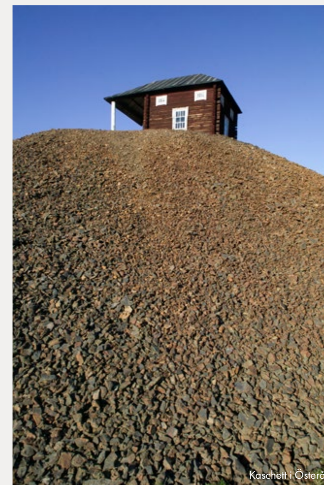
Kaschett i Österå

Världsarvet Falun är ett stort geografiskt område vilket möjliggör en rad olika upplevelser för boende och besökare. Världsarvet är indelat i områdena gruvan, staden och bergsmansbygden, vilket innebär en stor bredd och variation av platser och miljöer. I världsarvet finns den "ruffa" industrimiljön i form av gruvområdet och slagghögar runt om i landskapet, välbevarade trästadsdelar, en innerstad med kulturhistoriskt intressanta byggnader och bergsmanslandskapet som präglas av odlingslandskap och pampiga bergsmansgårdar med tillhörande trädgårdar. De olika besöksmålen är var och en intressanta, men uppfattas ofta som isolerade aktörer. Delar av de unika miljöerna är inte heller tillgängliga att besöka i nuläget, vilket både kan ses som en begränsning och en möjlighet att vidareutveckla och därigenom öka attraktiviteten ytterligare för världsarvet. Det är i nuläget svårt att uppfatta helheten av världsarvet,