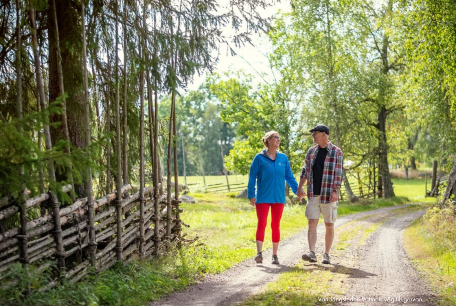
Vandringsteden Vattnets väg till gruvan

vilket gör att förståelsen för världsarvets unika värde riskerar att inte nå fram till befintliga och potentiella besökare.