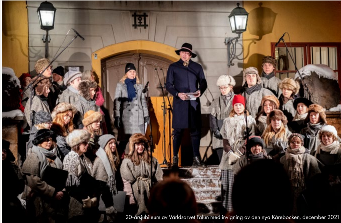
20-årsjubileum av Världsarvet Falun med invigning av den nya Kårebocken, december 2021

nationer och gator, torg och grönområden gestaltas och samspelar med varandra.