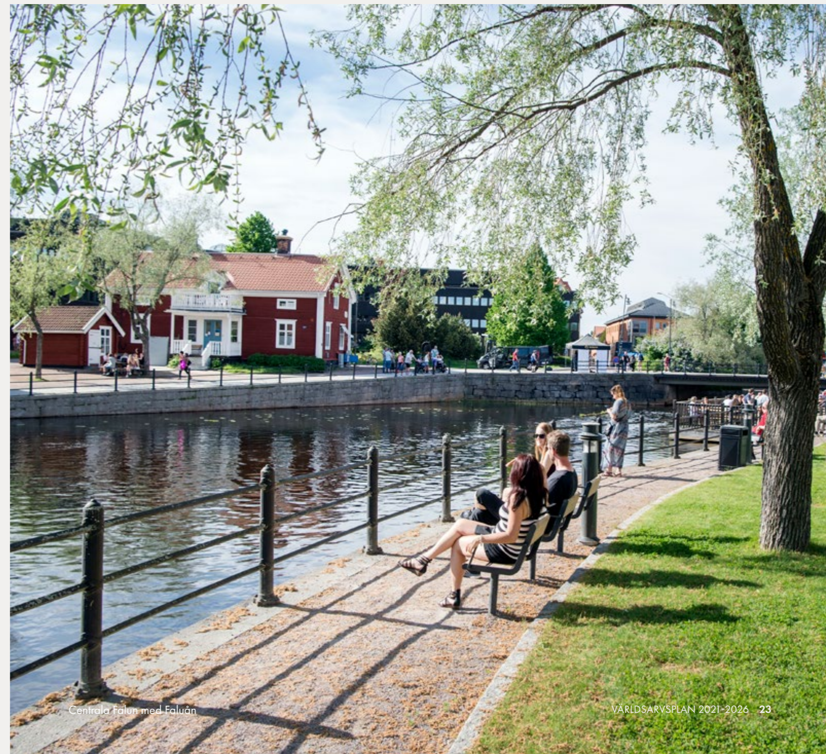
Centrala Falun med Falunån