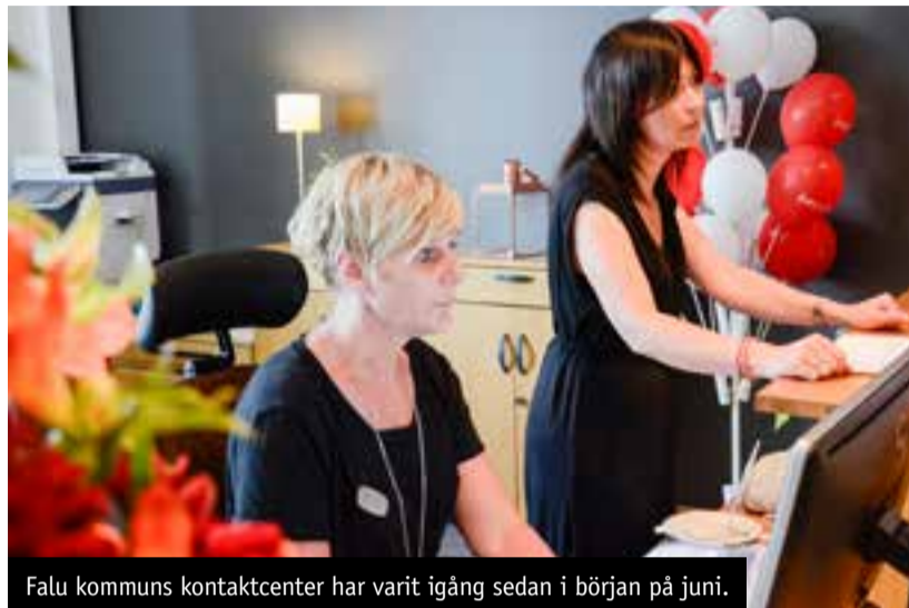
Falu kommuns kontaktcenter har varit igång sedan i början på juni.

■ KONTAKTCENTER/ För Falubornas del innebär ett kontaktcenter att det ska bli enklare att ta kontakt med kommunen, då man alltid vänder sig till samma ställe, alltid får svar och inte