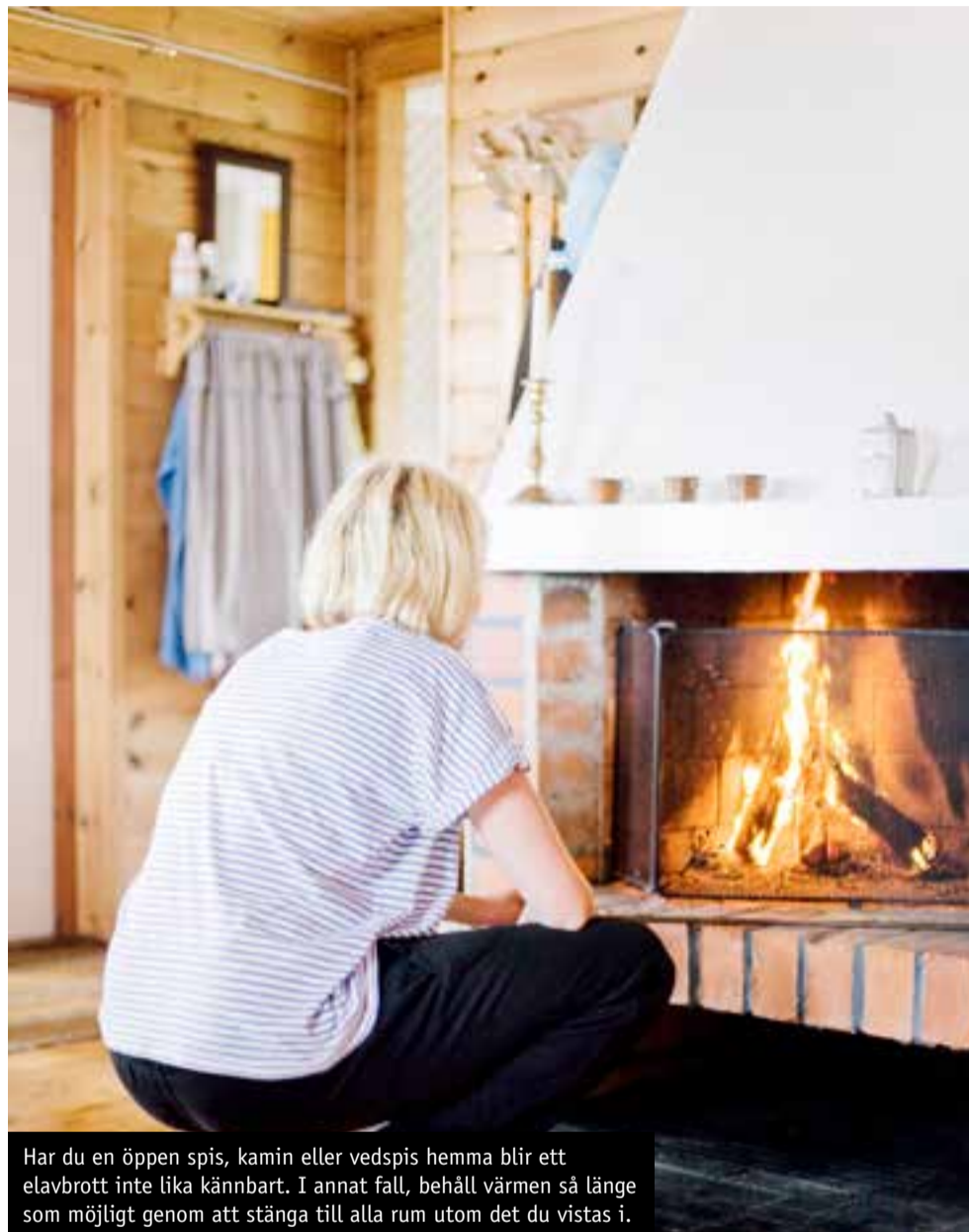
Har du en öppen spis, kamin eller vedspis hemma blir ett elavbrott inte lika kännbart. I annat fall, behåll värmen så länge som möjligt genom att stänga till alla rum utom det du vistas i.

Dels handlar det om att hantera händelsen, dels om att begränsa konsekvenserna för samhället.