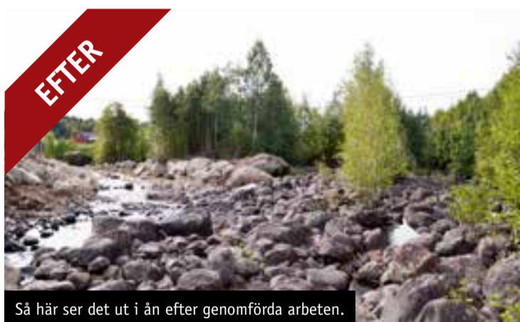
Så här ser det ut i ån efter genomförda arbeten.