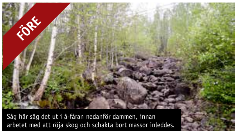
Såg här såg det ut i å-fåran nedanför dammen, innan arbetet med att röja skog och schakta bort massor inleddes.

"På det här sättet förhindrar vi framtida översvämningar och svåra skador."