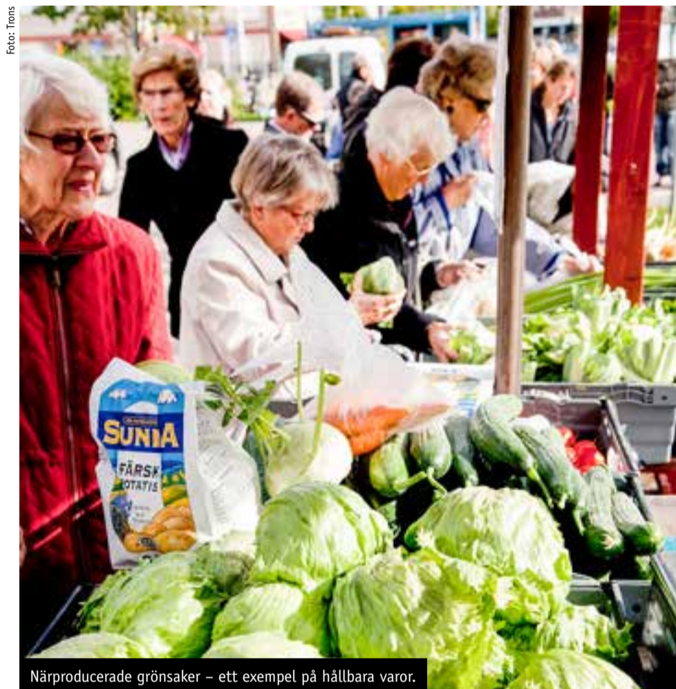
Närproducerade grönsaker – ett exempel på hållbara varor.

Under hållbarhetsveckan visar butikerna upp hållbara varor och tjänster, medan Falu kommun marknadsför kampanjveckan och arrangerar aktiviteter på stan. ■